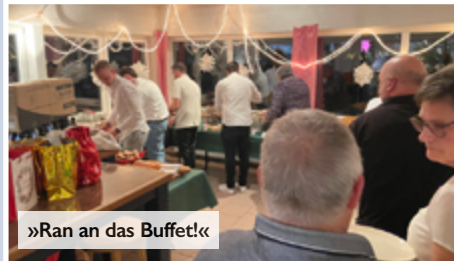
»Ran an das Buffet!«