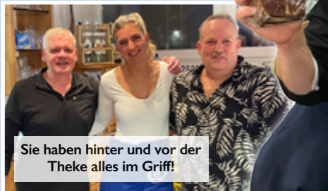
Sie haben hinter und vor der Theke alles im Griff!