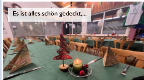
Es ist alles schön gedeckt,...