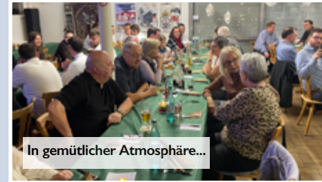
In gemütlicher Atmosphäre...