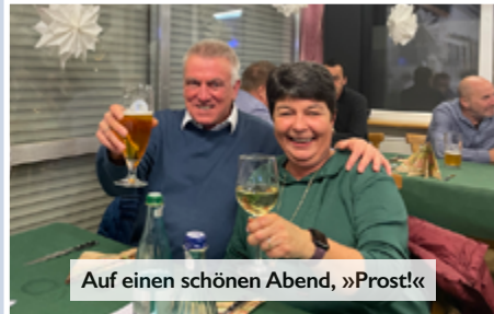
Auf einen schönen Abend, »Prost!«