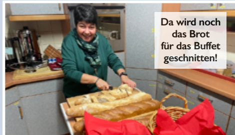
Da wird noch das Brot für das Buffet geschnitten!