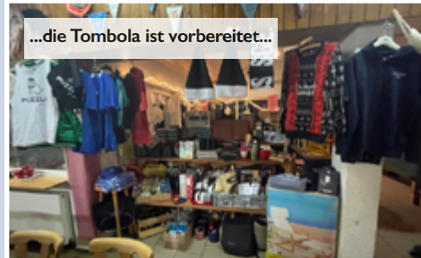
...die Tombola ist vorbereitet...