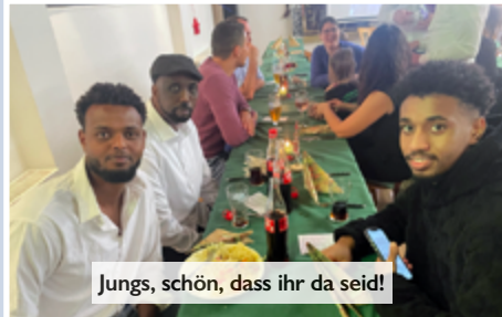
Jungs, schön, dass ihr da seid!