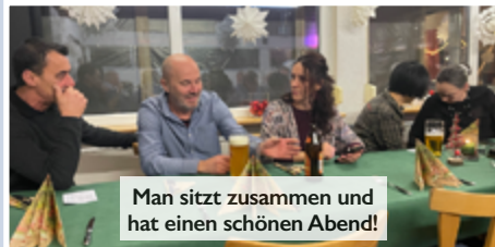
Man sitzt zusammen und hat einen schönen Abend!