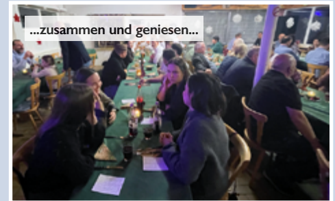
...zusammen und genießen...