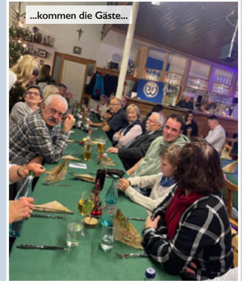
...kommen die Gäste...