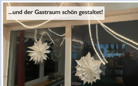
...und der Gastraum schön gestaltet!