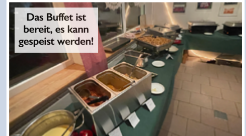
Das Buffet ist bereit, es kann gespeist werden!